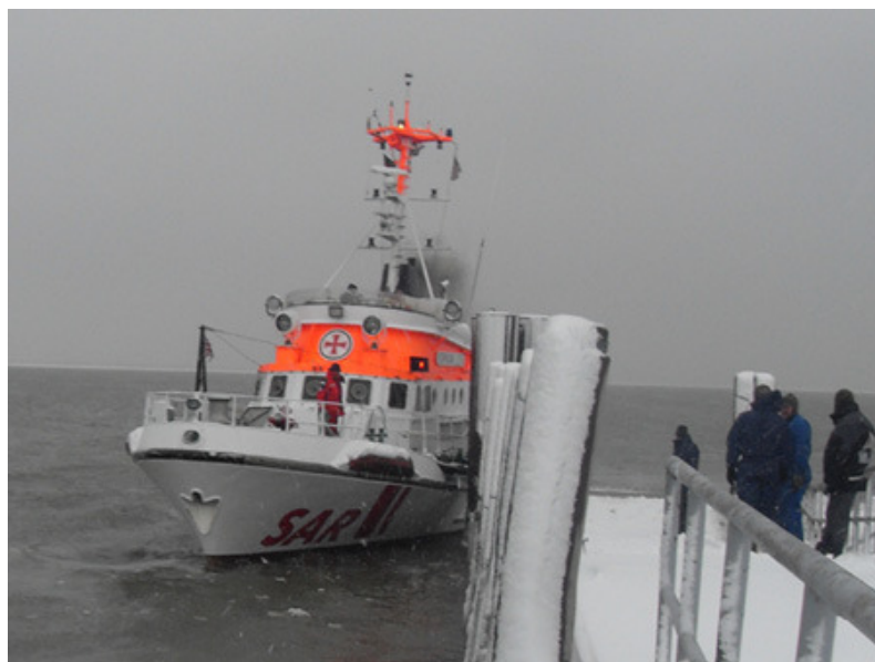
Aufnahmen vom 02. Februar 2010